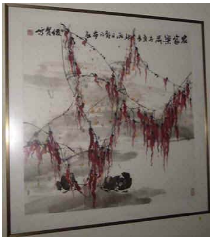
Xian Wei Yun (VRCH), Rote Trauerweide

Bildelemente, Bildkomposition und Text, damit Bedeutungen, beliebig tiefe Konnotationen werden als eigentliches Ergebnis des Kunsterlebnisses gesehen.